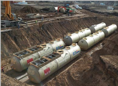
КОС ЭКО-Р-1000, ЖК "Цветы Башкирии", г. Уфа