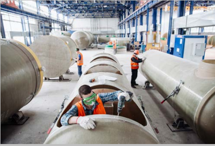
Производство г. Тольятти